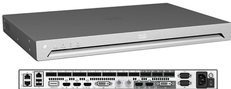
图 1. Cisco TelePresence SX80 编解码器

思科提供 3 种 SX80 集成包，以降低在大型会议室中装配视频对外部设备的要求和总体成本：