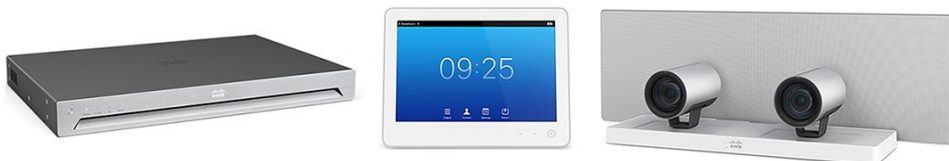
图 2. 配备有 Touch 10 和 SpeakerTrack 60 的 Cisco TelePresence SX80 集成包