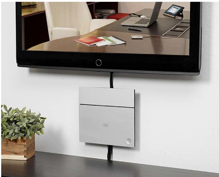
图 2. Cisco TelePresence SX20 Quick Set 壁挂式安装（可选件）