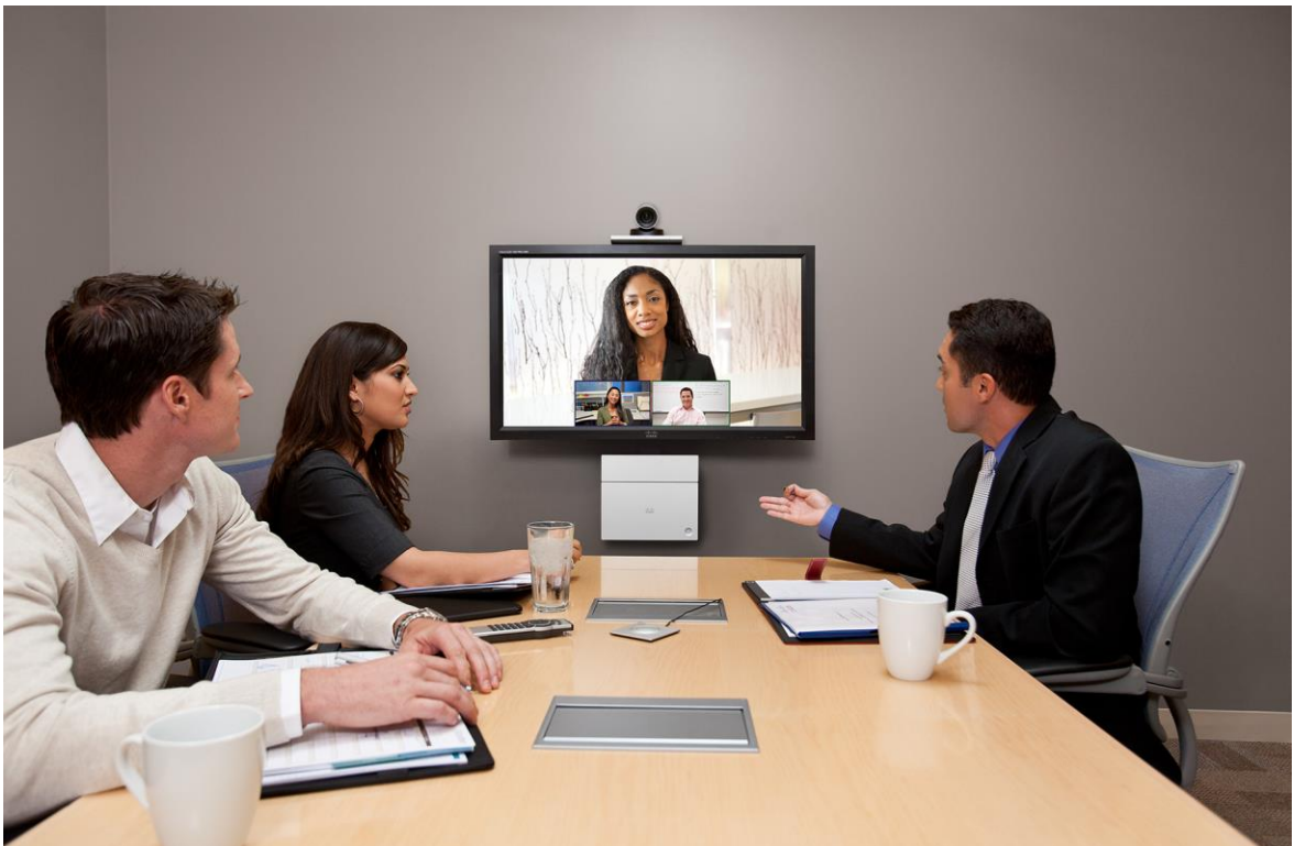
图 1. 中小型会议室环境中的 Cisco TelePresence SX20 Quick Set

SX20 Quick Set 在一个易于部署且简单易用的解决方案中，融入了强大的编解码器，支持 1080p60 高清分辨率，提供两种摄像机供选择，并支持双显模式。无论是刚开始使用网真的小型企业还是设法扩展现有部署的大型企业，SX20 Quick Set 都能够通过功能丰富的简约封装为您提供卓越性能，丝毫不逊于价格更高的系统。Cisco TelePresence SX20 Quick Set 旨在将面对面功能真正扩展至所有地点、所有用户。