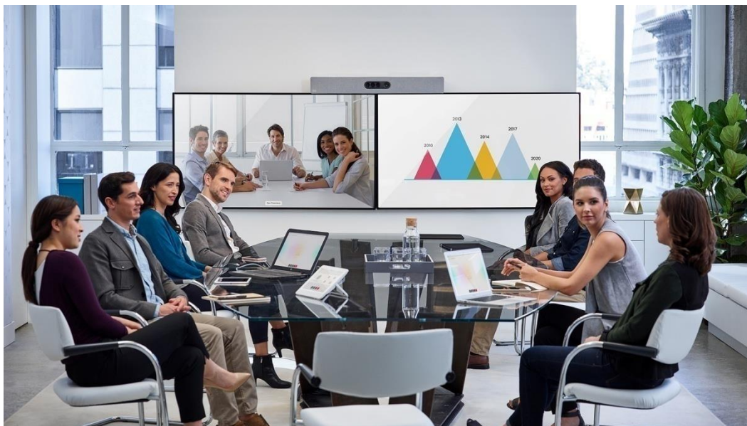
图 1. 用于大型会议室的思科 Spark Room Kit Plus

Room Kit Plus - 包括一个强大的编解码器和一个内置 4 个高清摄像机的镜头矩阵，集成扬声器和麦克风，非常适合大中型会议室使用。它采用先进的摄像机技术，使大中型会议室环境也能实现发言者跟踪和自动取景功能（跟踪距离可至 9 米）。在保证丰富的功能和体验的同时，该产品在定价和设计上也经过仔细考量，可确保轻松扩展到您的所有会议室和空间，无论您是选择自建部署注册还是通过思科® 协作云注册到思科 Spark，都能获得这些优势。