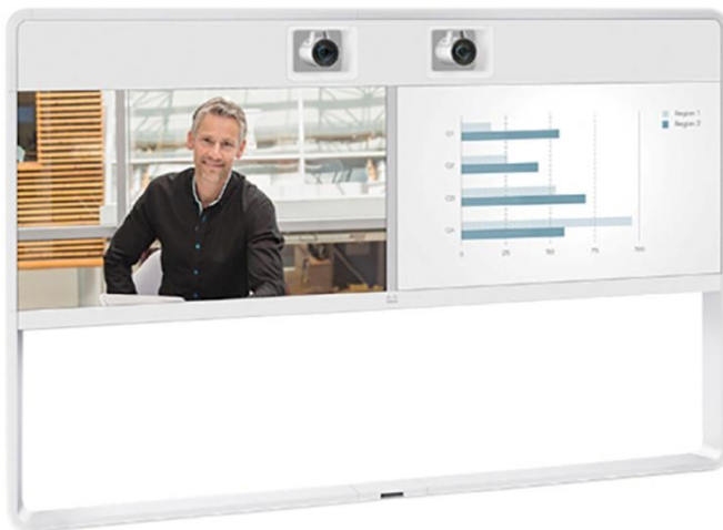
图 1. Cisco TelePresence MX700 配备拥有 55 英寸的双屏幕（MX700 和 MX800 均可以选择下图所示的双摄像机配置）

基于行业标准，MX700 和 MX800 支持与基于标准的第三方系统进行互联互通。此外，MX700 和 MX800 作为业界唯一支持 H.265 的系统，为实现更高的带宽利用率奠定了基础。MX700 和 MX800 现在支持通过云注册到 Cisco Spark 服务 ，以实现速度更快、性价比更高的部署。