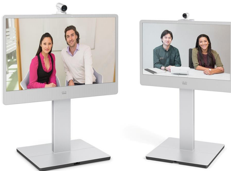
图 1. Cisco TelePresence MX300 G2 和 MX200 G2

Cisco MX300 G2 和 MX200 G2 系统像电视一样容易安装，且可在约 10 分钟内完成设置。其定价适合大规模部署，因此，您可以快速轻松地将任何会议场所转变为支持视频功能的团队会议室。配备 55 英寸屏幕的 MX300 G2 是中型会议室的理想选择。MX200 G2 配有 42 英寸屏幕，是中小型会议室的理想选择，因为它可以为狭小的空间打造宽广的视野。这两款产品均简单易用、经济实惠，使您的整个组织都可以进行视频协作。