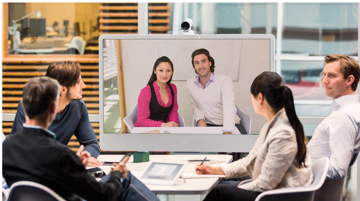
图 2. 落地式 Cisco TelePresence MX300 G2

Cisco TelePresence MX300 G2 和 MX200 G2 是思科完整的协作生态系统的一部分，该系统可提供您所期望的高品质、简单易用的网真体验，同时凭借快速的全球服务及高性价比，使得广泛部署从未变得如此简单而实惠。无论您是刚开始使用视频通信，还是计划在整个组织内实现视频功能，MX300 G2 和 MX200 G2 都可以满足您的需求。