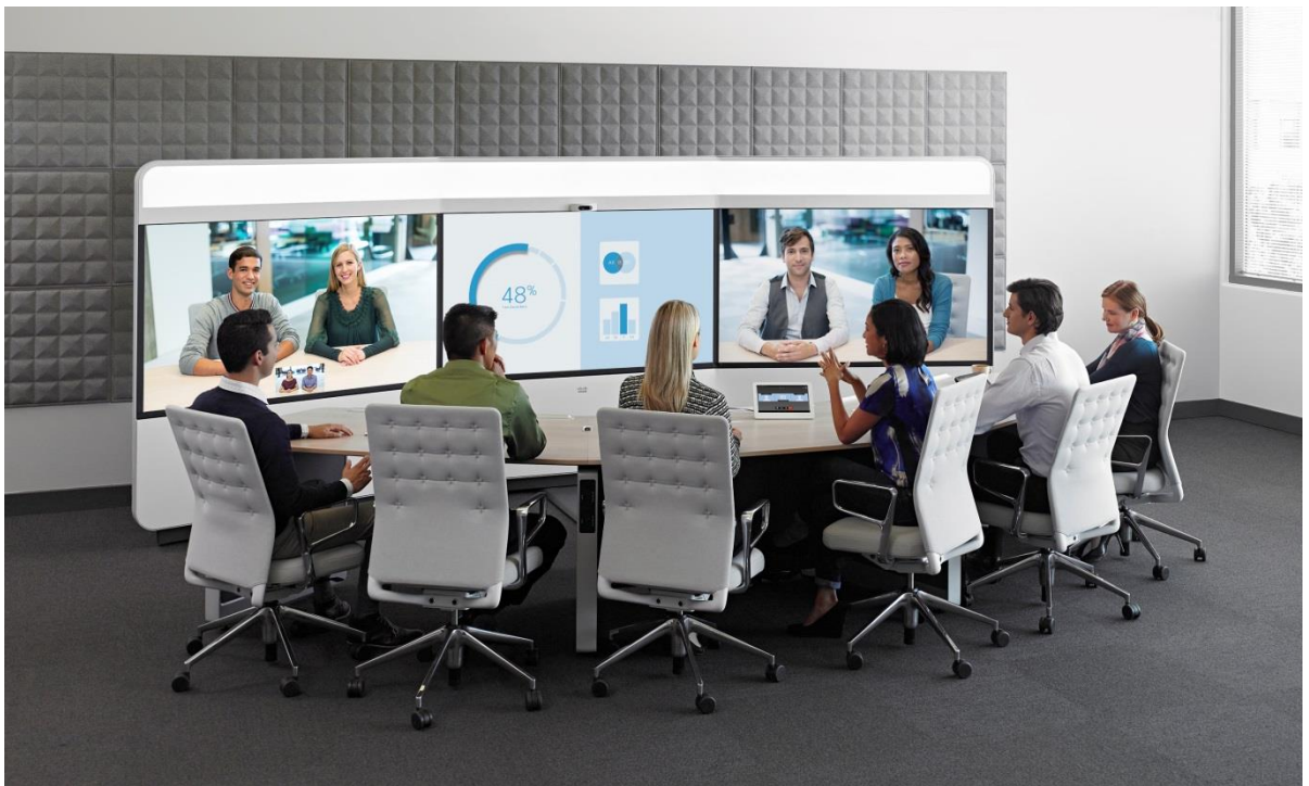
图1. 思科网真IX5000，6位与会者

这套造型优美且功能强大的系统采用了业界首创的3x4K超高清(Ultra High Definition - UHD)镜头集群，3x70英寸高清LCD显示屏以及剧场级音响系统，思科IX5000系列网真将人们置身于如同身处桌子对面的沉浸式协作体验。IX5000系列包括单排会议桌支持6位与会者的IX5000，以及双排会议桌支持18位与会者的IX5200两种型号。