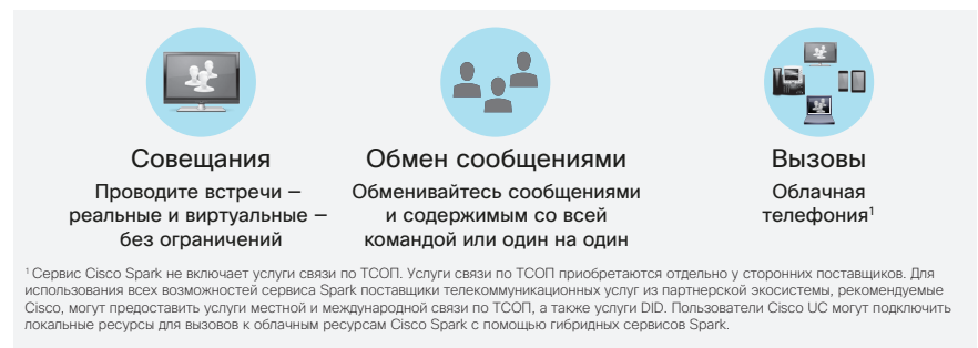
Рис. 1. Совместная работа стала проще благодаря Cisco Spark

Средства общения должны быть универсальными. Мобильными. Предназначены для совместной работы. Все это стало возможным благодаря широкому распространению мобильных устройств и постоянному развитию сетевой инфраструктуры и приложений. В основе сервиса мгновенных сообщений и виртуальных совещаний Cisco Spark лежит тщательно подобранный комплект лучших в отрасли средств коммуникации: объединенные мощными облачными ресурсами Cisco, они создают абсолютно новый способ совместной работы.