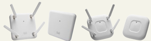
Cisco Aironet シリーズ

©2015 Cisco Systems, Inc. All rights reserved.