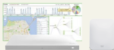
Cisco Meraki MR シリーズ