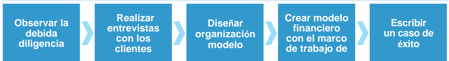
FIGURA 3 Enfoque de TEI

Dada la sofisticación creciente de las empresas en cuanto a los análisis de ROI relacionados con las inversiones en TI, la metodología de TEI de Forrester sirve para ofrecer una imagen completa del impacto económico total de las decisiones de compra. Consulte el apéndice A para más información acerca de la metodología de TEI.