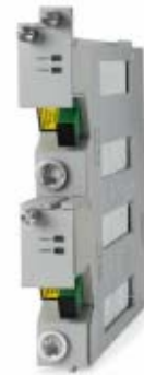
在一个模块中的两个 高密度双正向接收机