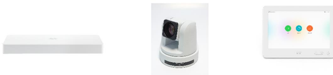
图 1. 思科 Webex Room Kit Plus PTZ

在保证丰富的功能和体验的同时，Room Kit Plus PTZ 集成包在定价与设计上也经过仔细考量，可确保轻松扩展到您的所有协作空间。无论您是选择本地部署注册还是向云端的思科 Webex 注册，都能获得这些优势。图 1 所示为该集成包的组件。