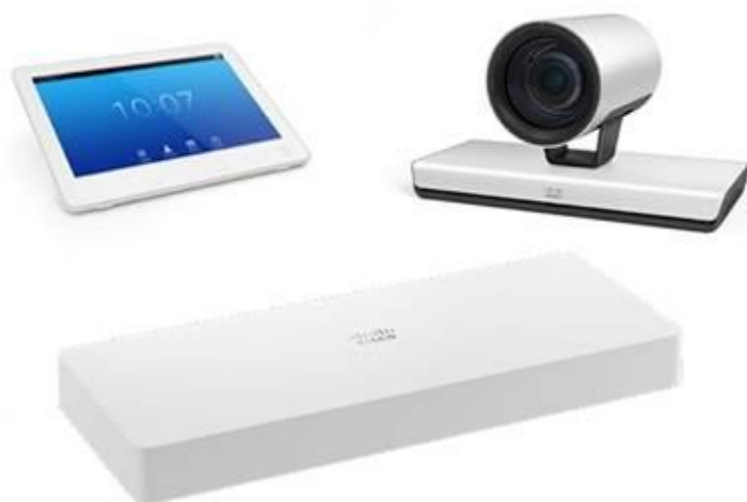
图 1. 用于大型会议室的思科 Webex Room Kit Plus P60 Integrator Package

尽管 Room Kit Plus P60 高清视频会议设备组合具备颇为丰富的功能性和用户体验，但在价格和设计方面却展现出很大的灵活性，能满足企业各种会议空间的需求 - 您可在企业内部完成注册，或通过思科®协作云将其注册到思科 Webex 平台。