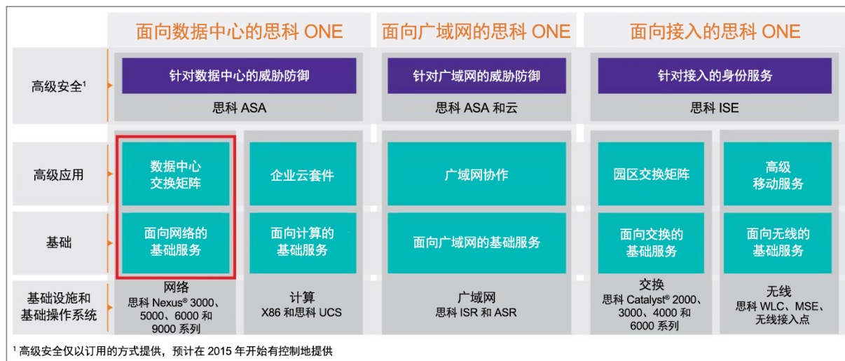
图 1. 思科 ONE 软件

面向数据中心网络的思科 ONE 软件套件可为物理、虚拟和基于云的数据中心提供丰富的网络功能及创新特性。针对思科 Nexus® 系列数据中心交换产品组合提供思科 ONE 数据中心网络基础软件套件和思科 ONE 数据中心交换矩阵高级软件套件，功能众多，可帮助您构建扩展性良好、恢复能力强、简洁且更高效的数据中心网络架构（图 1）。