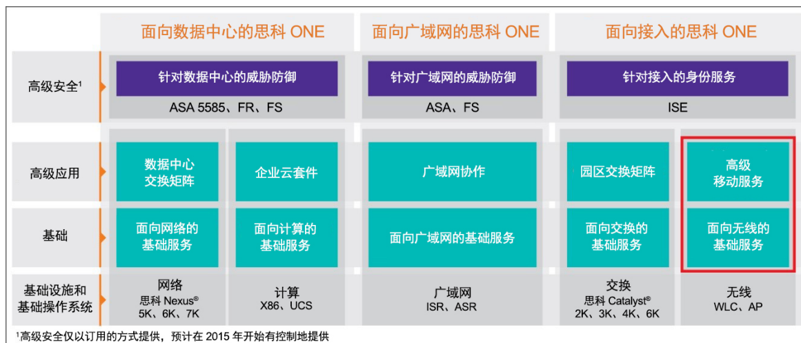
图 1. 思科 ONE 软件