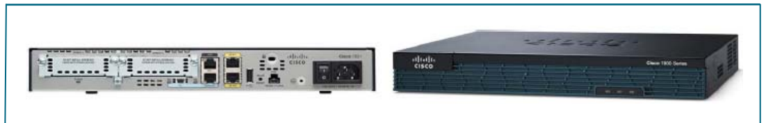
图 1. Cisco 1921 集成多业务路由器

Cisco 1921 建立在 Cisco 1841 集成多业务路由器的一流产品基础之上。所有 Cisco 1900 系列集成多业务路由器产品均可提供嵌入式硬件加密加速、可选防火墙、入侵防御和高级安全服务。此外，该平台还可支持业界范围最广的有线和无线连接选择，如串行、T1/E1、xDSL、千兆位以太网和第三代（3G）无线等（图 1）。