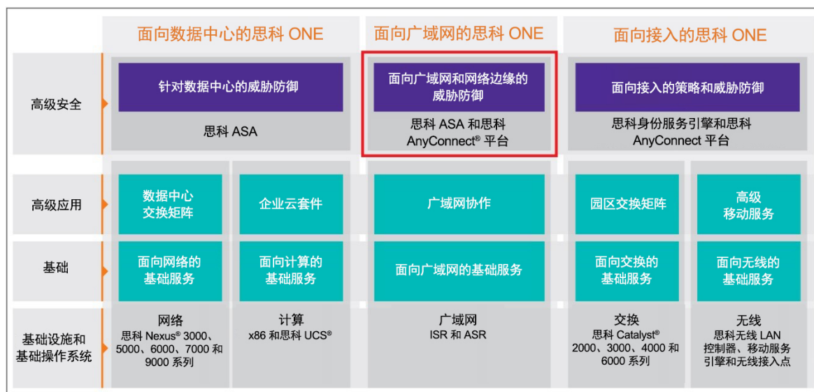
图 1. 思科 ONE 软件