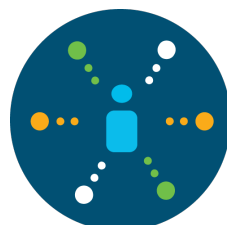
协调产品支持团队