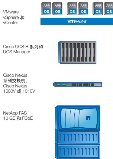
图 1) FlexPod for VMware 解决方案。