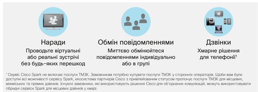
Рис. 1. Спілкуйтеся ефективніше за допомогою Cisco Spark

Комунікація має бути гнучкою та мобільною, а також сприяти спільній роботі. Усе це досягається завдяки інноваційним мобільним пристроям, інфраструктурі та програмам. За допомогою Cisco Spark можна ефективно спілкуватися і проводити наради в реальному часі через інтегрований набір найкращих у галузі інструментів для спільної роботи.