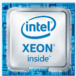
Системы Cisco HyperFlex™ с процессорами Intel® Xeon®

Наша платформа включает в себя гибридные конфигурации СХД или конфигурации на основе флеш-массивов, интегрированную фабрику коммутации и мощные функции оптимизации данных, позволяющие использовать весь потенциал гиперконвергенции для широкого спектра рабочих нагрузок и сценариев применения. Наше решение отличается ускоренным развертыванием, упрощенным управлением и более удобным масштабированием по сравнению с текущим поколением систем. Решение предоставит вам унифицированный пул инфраструктурных ресурсов для работы приложений в соответствии с вашими бизнес-потребностями.