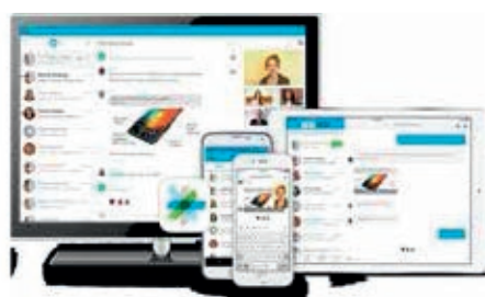
Rysunek 2. Udostępnij jedno narzędzie i spójny standard usług każdemu pracownikowi

Usługa Cisco Spark oferuje zestaw zaawansowanych rozwiązań komunikacyjnych umożliwiających kontakt w każdej formie, jakiej potrzebujesz. Być może prowadzisz start-up i korzystasz z tymczasowego rozwiązania, lub z systemu, który jest przestarzały i chcesz go unowocześnić. Być może Twoja firma już przeniosła swoją komunikację do sieci lub korzysta z usług chmurowych, ale potrzebuje bardziej zaawansowanych możliwości. Cisco Spark przeniesie Twoją komunikację na następny poziom, zapewniając korzyści jednego narzędzia biznesowego wszystkim pracownikom Twojej organizacji: jedno narzędzie, spójny standard, dla wszystkich (Rysunek 2).