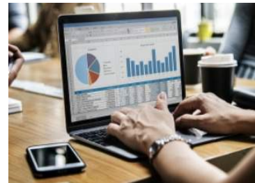
매출 전표 처리 및 고객분석앱