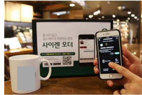
앱 결제 및 전자영수증