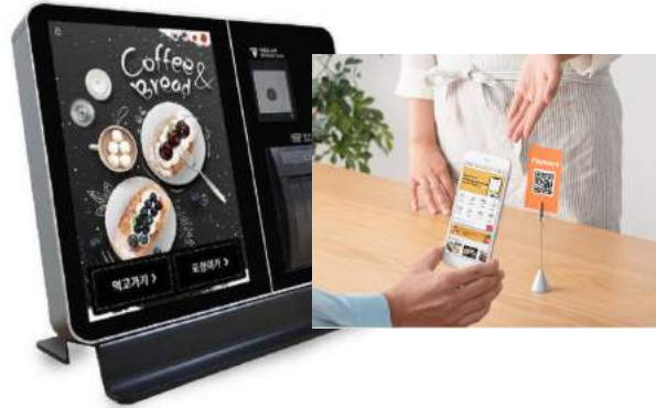
키오스크나 QR 주문