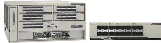
그림 2는 Cisco Catalyst 6880-X 스위치의 일반적인 구축 형태입니다.

그림 1은 Cisco Catalyst 6880-X와 포트 카드를 나타냅니다.