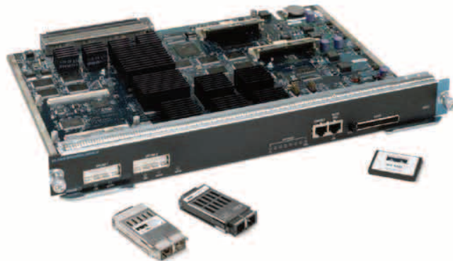
그림 1 Cisco Catalyst 4000 계열 Supervisor Engine IV

Cisco Catalyst Supervisor Engine IV는 성능이 입증된 Cisco IOS® Software로 차세대 스위칭 기술을 구현하여 음성, 비디오 및 데이터가 컨버전스된 네트워크에서 확장 가능하고 지능적인 멀티 레이어 스위칭 솔루션을 사용할 수 있게 합니다. 기업의 와이어링 클로젯(wiring closet), 지사의 백본 또는 레이어3 분배 포인트를 위해 최적화된 Cisco Catalyst Supervisor Engine IV는 오늘과 내일의 네트워크 애플리케이션을 모두 관리할 수 있는 성능과 확장성을 제공합니다. Catalyst 4000 계열 Supervisor Engine IV는 광범위하게 설치되어 있는 Cisco Catalyst 4006 새시와 새로운 Cisco Catalyst 4500 Series 새시, 그리고 기존의 Cisco Catalyst 4000 Series 라인 카드와 호환되어 설치 범위가 확대되므로, 모듈형 Cisco Catalyst 4000 Family의 확장성은 더욱 강화됩니다.