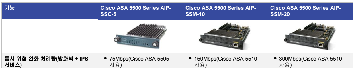
표 2. Cisco ASA 5500 Series AIP SSM 및 AIP SSC 모델의 특성

표 2에서는 사용 가능한 AIP SSM 및 AIP SSC 모델과 각 모델의 성능 및 물리적 특성에 대해 자세히 설명합니다.