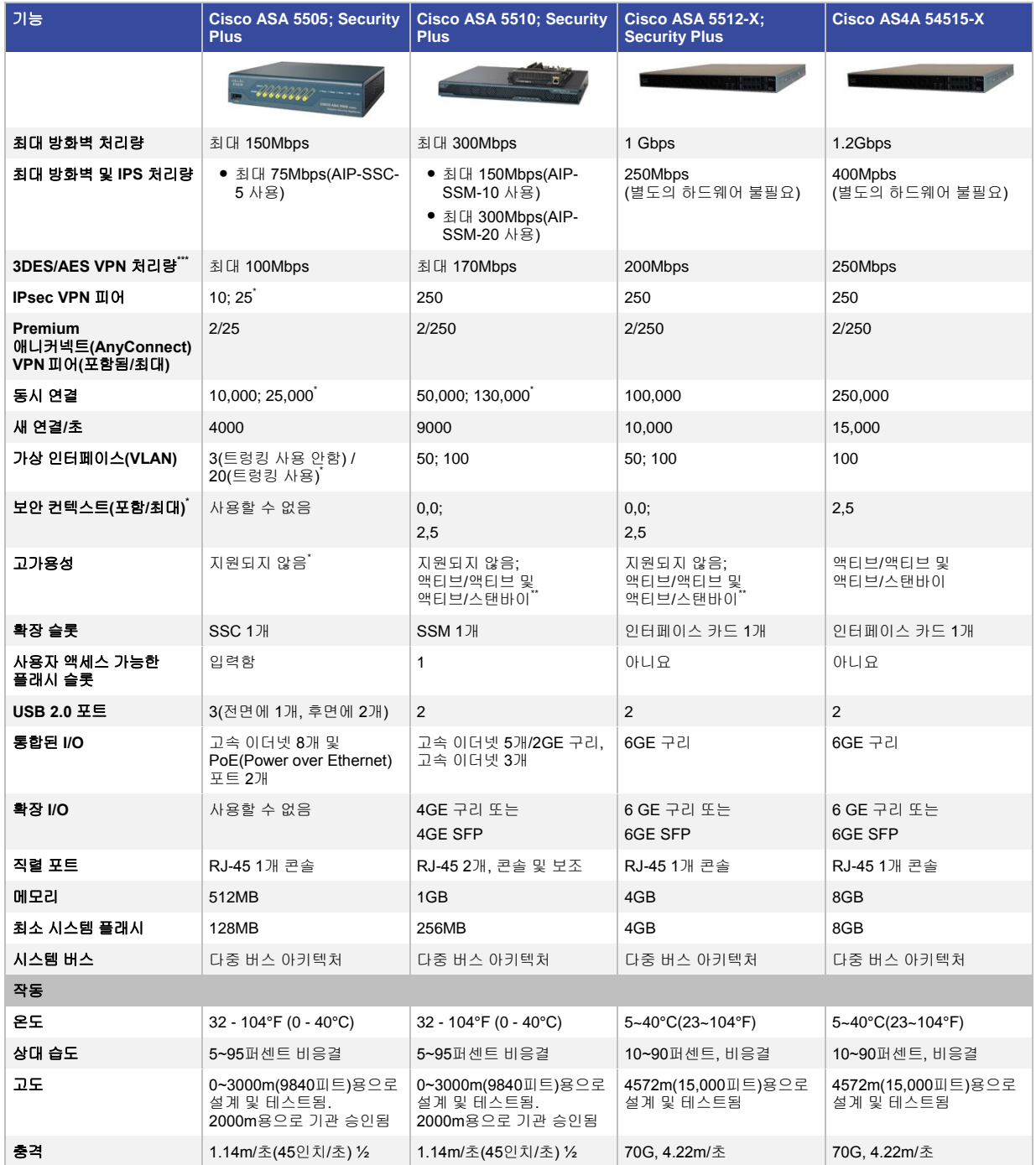
표 1. 소규모 사무실 및 지사용 Cisco ASA 5500 Series Appliance

* 별도의 라이센스 기능입니다. 기본 시스템과 두 개의 SSL 라이센스를 포함합니다.