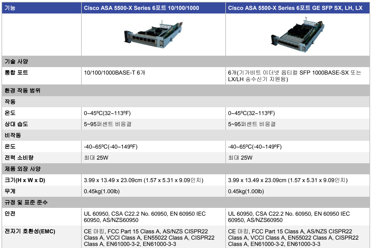
표 5. Cisco ASA 5500-X Series 6포트 기가비트 이더넷 인터페이스 카드의 특성

표 5에는 Cisco ASA 5500-X Series 6포트 기가비트 이더넷 인터페이스 카드의 특성이 나열되어 있습니다.