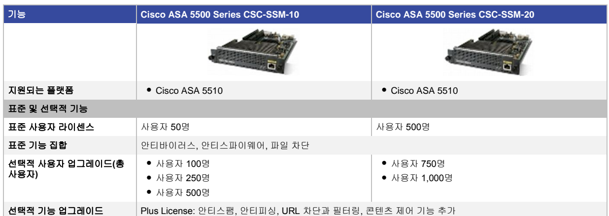
표 3. Cisco ASA 5500 Series CSC SSM의 특성

각 CSC SSM에 대해 추가 요금으로 이용할 수 있는 Plus License는 안티스팸, 안티피싱, URL 차단과 필터링, 콘텐츠 제어 서비스 등의 기능을 제공합니다. 기업은 추가 사용자 라이선서를 구매 및 설치하여 CSC SSM의 사용자 용량을 늘릴 수 있습니다. 이러한 옵션에 대한 자세한 내용은 표 3 및 CSC SSM 데이터시트에서 제공합니다.