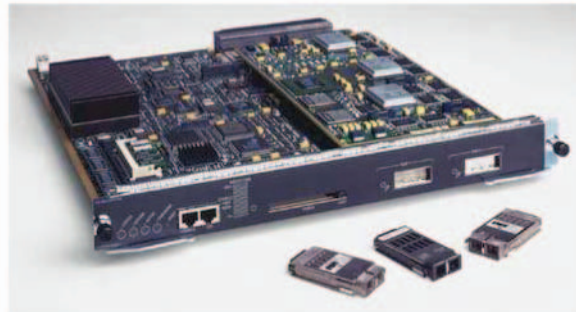
그림 5 Cisco Catalyst 6500 Supervisor Engine 1A-PFC