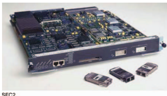
그림 4 Cisco Catalyst 6500 Supervisor Engine 1A-PFC/MSFC2