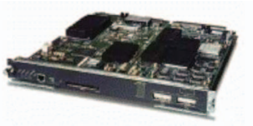
그림 3 Cisco Catalyst 6500 Series Supervisor Engine 2-MSFC2