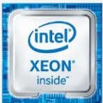
Intel® Xeon® 프로세서가 탑재된 Cisco HyperFlex™ 시스템

Cisco UCS는 (대용량 디스크가 탑재된) Cisco HyperFlex HX-시리즈 노드와 (고성능 컴퓨팅 시스템이 탑재된) Cisco UCS B-시리즈 블레이드 서버를 하나의 클러스터에 통합함으로써 연결 및 하드웨어 관리 환경을 단일화합니다. 시스코와 함께 하면, 애플리케이션에 따라 적절한 조합의 CPU와 디스크 스토리지를 선택할 수 있습니다. 다시 말해서, 시스코는 여타 솔루션 제공업체보다 더 다양한 선택권을 고객에게 제시해 Cisco HyperFlex 시스템을 최적화할 수 있도록 지원합니다. 점진적 확장도 용이해서 일단 작은 규모로 주문해서 구현한 후 필요에 따라 조금씩 확장할 수 있습니다. Cisco HyperFlex 시스템을 이용하면 Cisco UCS의 모든 비용 절감 효과 및 성능 이점 외에도 폭넓은 Cisco UCS 관리 파트너 에코시스템의 장점을 최대한 활용할 수 있습니다.