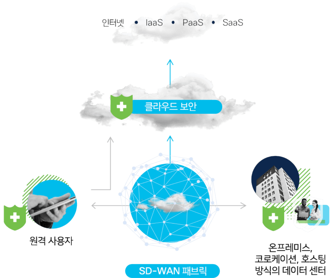
그림 1: 시스코 SASE 아키텍처

한편 Cisco Secure Access by Duo는 연결에 앞서 사용자의 신원과 디바이스 상태를 확인합니다.