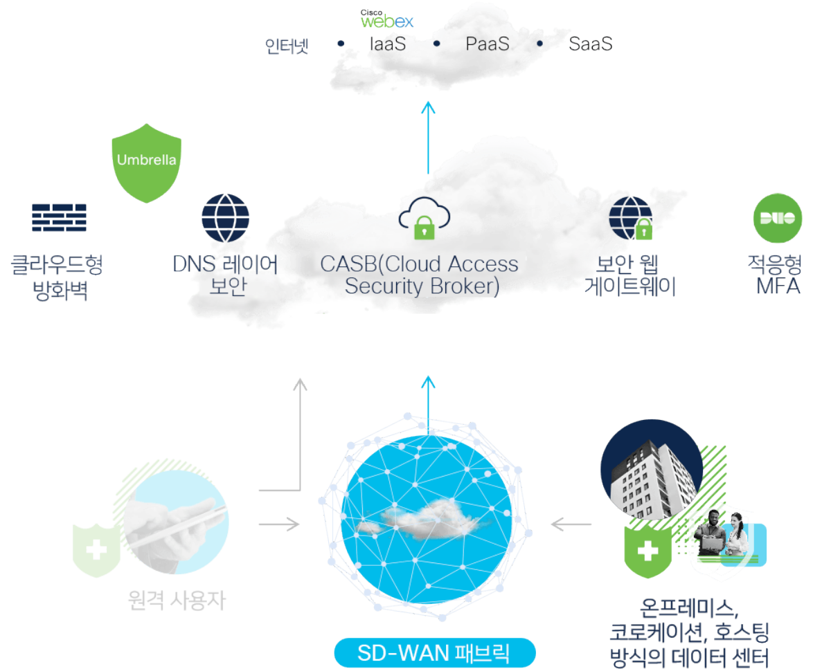
그림 3: Cisco SD-WAN으로 구축한 브랜치 아키텍처

SD-WAN 패브릭에서 수천 개의 브랜치에 대한 클라우드 보안을 자동 구축하고 즉시 위협을 차단하세요. SASE로의 간편하고 직관적인 온보딩을 통해 어떤 클라우드로의 어떤 전송에서든 사용자를 보호하고 연결합니다. Cisco SD-WAN은 모든 브랜치 위치 사이에 구축된 원클릭 풀 메쉬 VPN을 통해 자동 터널링을 제공하므로, 간편하게 규모를 늘리거나 줄일 수 있습니다. 기업의 의도에 맞게 지정된 엔드 투 엔드 보안 세그멘테이션으로 온프레미스 및 코로케이션 시설에서 AWS, Azure 등 통합 클라우드 서비스에 이르기까지 브랜치에 필요한 모든 것에 안전하게 연결할 수 있습니다.