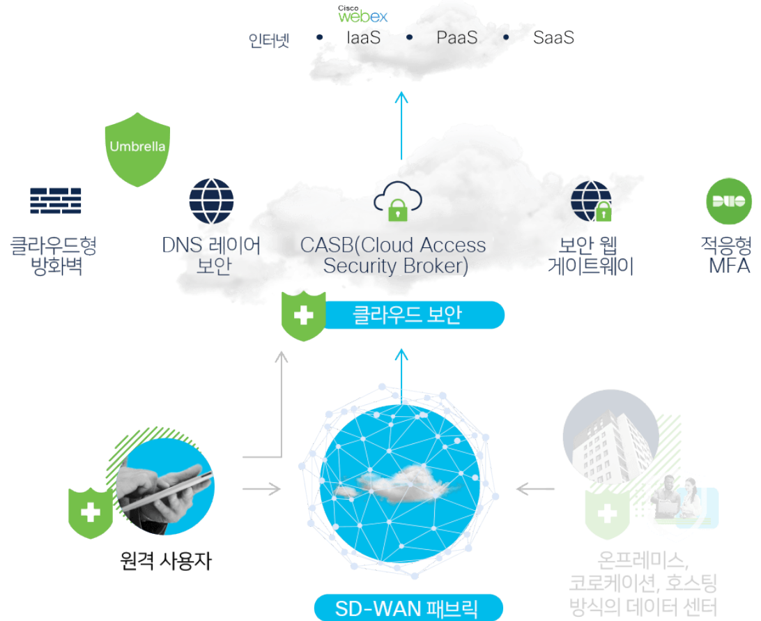
그림 2: 시스코 보안 원격 액세스 아키텍처

Umbrella는 단일 정책에 따른 단일 푸시 방식으로 보안 연결을 제공하며, 모든 과정이 업계에서 가장 포괄적인 사이버 보안 플랫폼에서 이루어집니다.