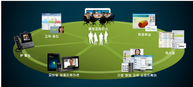
그림 2. Cisco 협업 포트폴리오

개방성과 호환성을 고려한 Cisco의 접근방식은 기존과 새로운 협업 기술을 혼용(mix-and-match) 방식으로 통합하는 동시에 특정 기술에 "구속될" 위험요소를 배제하고 온프레미스, 클라우드, 또는 두가지 혼합으로 유연한 호스팅 구축 옵션을 제공합니다.