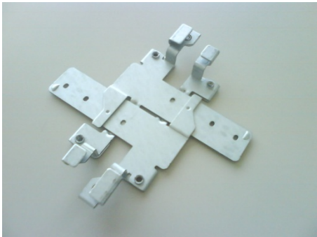
AIR-AP-T-RAIL-R* 天井グリッド クリップ (埋め込み型) デフォルトのオプション