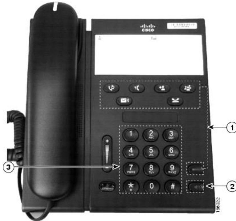
図 3：運動障がい者向けの機能：Cisco Unified IP Phone 6911 を表示

次の図に、例外として特記されている場合を除き、Cisco Unified IP Phone 6901 および 6911 でサポートされている機能を示します。次の図に示す機能の説明を下の表に示します。表の下に示した追加機能に注意してください。