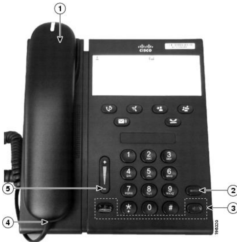
表 1：聴覚障がい者向けのアクセシビリティ機能