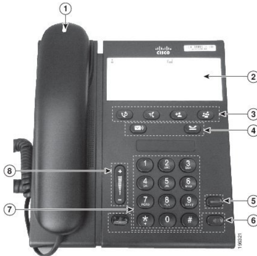
図 2：視覚障がい者向けアクセシビリティ機能：Cisco Unified IP Phone 6911 を表示

次の項に、例外として特記されている場合を除き、Cisco Unified IP Phone 6901 および 6911 でサポートされている機能を示します。次の図に示す機能の説明を下の表に示します。表の下に示した追加機能に注意してください。