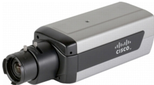
図 1. Cisco Video Surveillance 6500PD IP カメラ

Cisco Video Surveillance 6500PD IP カメラには、次のようなさまざまな利点があります。