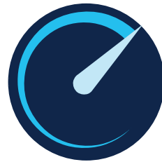
最適化された IT リソース