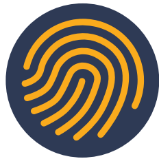
セキュアなネットワーク

Cisco HyperFlex Edge、Cisco SD-WAN、および Cisco Intersight Software as a Service を実現