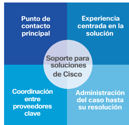
Figura 1. Características del soporte de soluciones de Cisco

Podemos ayudarlo a aprovechar al máximo su inversión en las redes incrementando la confiabilidad y el rendimiento de sus productos de seguridad con el soporte de soluciones de Cisco para la seguridad de la red. Este servicio ofrece la experiencia en soluciones y la responsabilidad de Cisco para administrar y resolver problemas de forma centralizada entre los productos Cisco y sus partners de la solución dentro de las soluciones de seguridad de Cisco (Figura 1).