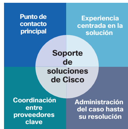
Figura 1. Características del soporte de soluciones de Cisco

Nuestra respuesta a las necesidades de estos clientes es el soporte de soluciones de Cisco para FlexPod. Este servicio ofrece la experiencia de Cisco FlexPod y su responsabilidad para administrar y resolver problemas de forma centralizada entre los productos Cisco y sus partners tecnológicos dentro de la solución FlexPod. Este servicio ayuda a incrementar la confiabilidad y el rendimiento de la solución para que aproveche al máximo su inversión en la tecnología (Figura 1).