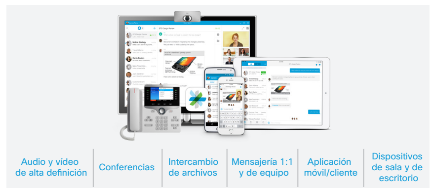
Figura 2. Ofrezca un servicio y una experiencia para cada empleado

El servicio Cisco Spark ofrece un eficaz conjunto de servicios de comunicación para todas las formas de comunicación que necesite. Quizás la suya es una empresa emergente con una solución ad-hoc o dispone de un sistema de llamadas o PBX desfasado y desea actualizarlo. Quizás ya ha migrado a IP o ha implementado un servicio basado en la nube y desea ampliar sus capacidades para llegar aún más lejos. Cisco Spark llevará sus comunicaciones a otro nivel al proporcionar las ventajas de un servicio de colaboración empresarial completo para todos los miembros de su empresa: un servicio, una experiencia que todos disfrutan (Figura 2).