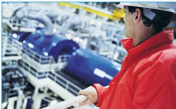
Erhöhte Sicherheit der Mitarbeiter