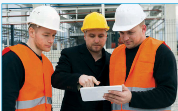
Branchenübergreifende Zusammenarbeit und universelle Einsetzbarkeit von Werkzeugen durch offene Standards

Um höchste Qualitätsstandards in der industriellen Fertigung zu erzielen, ist die Verbindung von Werkzeugen, Menschen und Prozessen im Produktionsbereich unverzichtbar. Das multinationale Maschinenbau- und Elektronikunternehmen Bosch hat die Vorteile einer vernetzten Produktion erkannt und mit Cisco zusammengearbeitet, um die Produktqualität und die Sicherheit der Mitarbeiter zu verbessern.