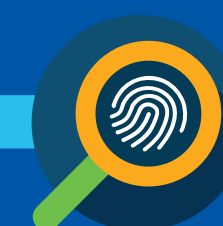
Einblicke und Forensik