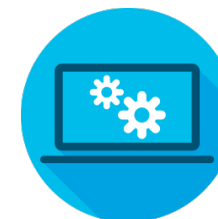
Forensik und Troubleshooting - Zeitmaschine für das RZ