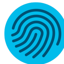
Umsetzen von Sicherheitsrichtlinien über Server-Firewall