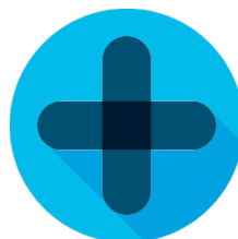
Application Dependency Mapping und Erzeugung von White-List-Policies

Aufgrund der Granularität und Umfänglichkeit der Informationserhebung und der Vorhaltung historischer Kommunikationsdaten über mehrere Monate ist Tetration Analytics insbesondere zum Nachweis der Einhaltung von Compliance-Richtlinien (z.B. zur Segmentierung von Applikationen) prädestiniert.