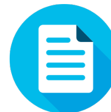
Policy und auditable Compliance