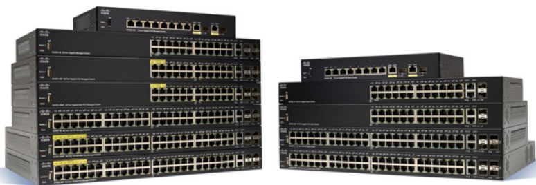
思科 350 系列管理型交换机 以太网交换机