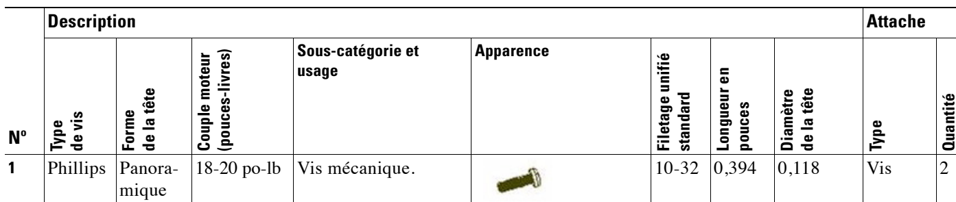
Tableau 1 Attaches (non représentées à l'échelle exacte)

Le Tableau 2 montre les pièces soudées contenues dans le kit de produit.