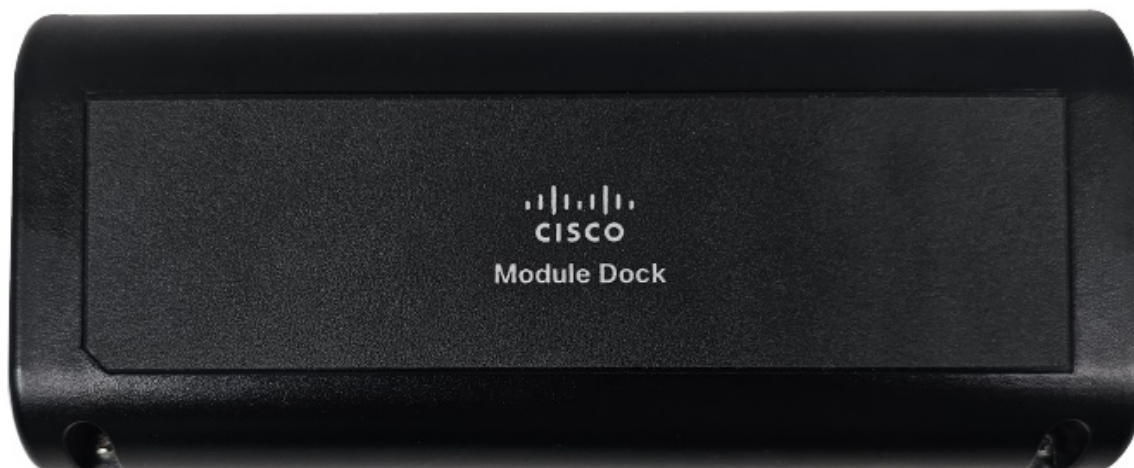
Illustration 1 : Cisco Provider Connectivity Assurance Module Dock

Le tableau suivant répertorie les caractéristiques du Module Dock.