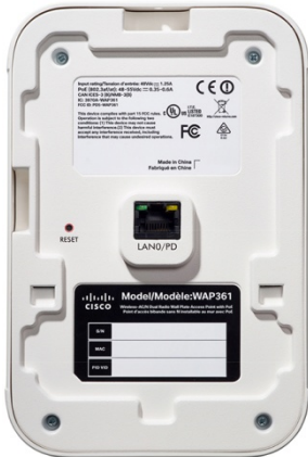
Abbildung 4. Seitenteil des WAP361 Wireless-AC/N Dual Radio Wall Plate Access Point