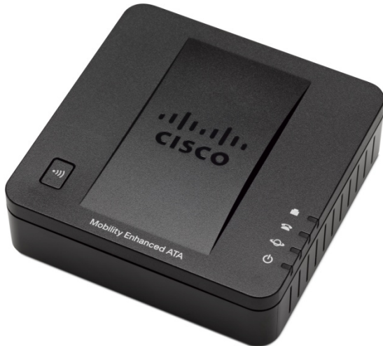
Abbildung 2. Ports am Cisco SPA232D