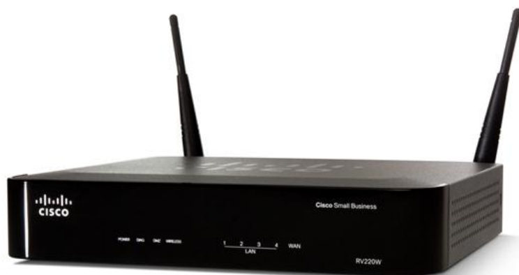
Figura 1. Firewall Cisco RV220W per la sicurezza della rete

Per garantire ulteriore protezione per la rete e i dati, Cisco RV220W include funzionalità di sicurezza di livello aziendale e funzioni opzionali di filtraggio Web basato su cloud. L'installazione è semplice grazie a un'utilità di configurazione e procedure guidate basate su browser.