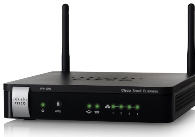
Figura 1. Firewall VPN Cisco RV110W Wireless-N

Il Firewall VPN Cisco® RV110W Wireless-N offre connettività a Internet di livello aziendale, semplice, conveniente e con sicurezza elevata per piccoli uffici, uffici domestici e lavoratori remoti.