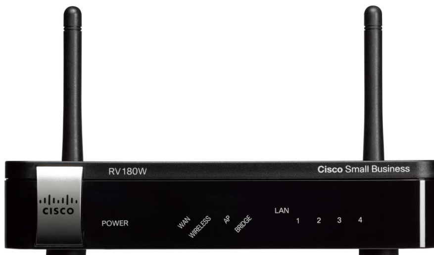
Figura 1. Router VPN multifunción Cisco RV180W (panel frontal)

Router multifunción de clase empresarial confiable que evoluciona con sus necesidades empresariales