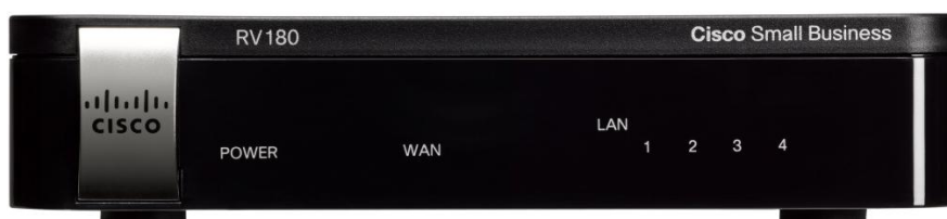
Figura 1. Router VPN Cisco RV180 (pannello anteriore)

Connettività sicura e ad alte prestazioni a un prezzo conveniente.