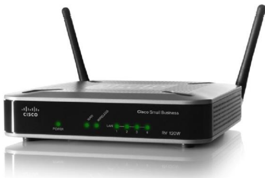
Figure 1. Pare-feu VPN sans fil N Cisco RV120W

Le pare-feu VPN sans fil N Cisco® RV120W combine une connectivité hautement sécurisée (à Internet et depuis d'autres sites et travailleurs distants), un point d'accès sans fil 802.11n haut débit, un commutateur 4 ports, un gestionnaire de périphériques intuitif basé sur navigateur et la prise en charge de Cisco FindIT Network Discovery Utility, à un prix très abordable. L'association de performances élevées, de fonctionnalités de type professionnel et d'une expérience utilisateur de qualité supérieure élèvent la connectivité de base à un rang supérieur (figure 1).