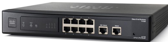
Figura 1. Router VPN Dual WAN Cisco RV082

Per garantire maggiore protezione della rete e dei dati, Cisco RV082 include funzioni di sicurezza di classe business e soluzioni opzionali di filtraggio Web basate su cloud. La configurazione è facile e veloce grazie all'intuitivo strumento di gestione dei dispositivi basato su browser e alle procedure di installazione guidata.